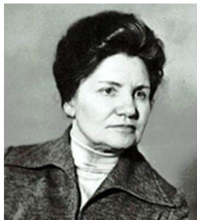
Н.И.Нисевич (1911–2008 г.)