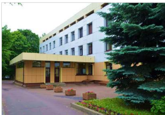
Ул.Цандера,д.5, Поликлиническое подразделение